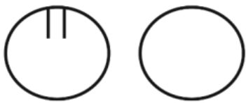
Ring mit und ohne Endhaken